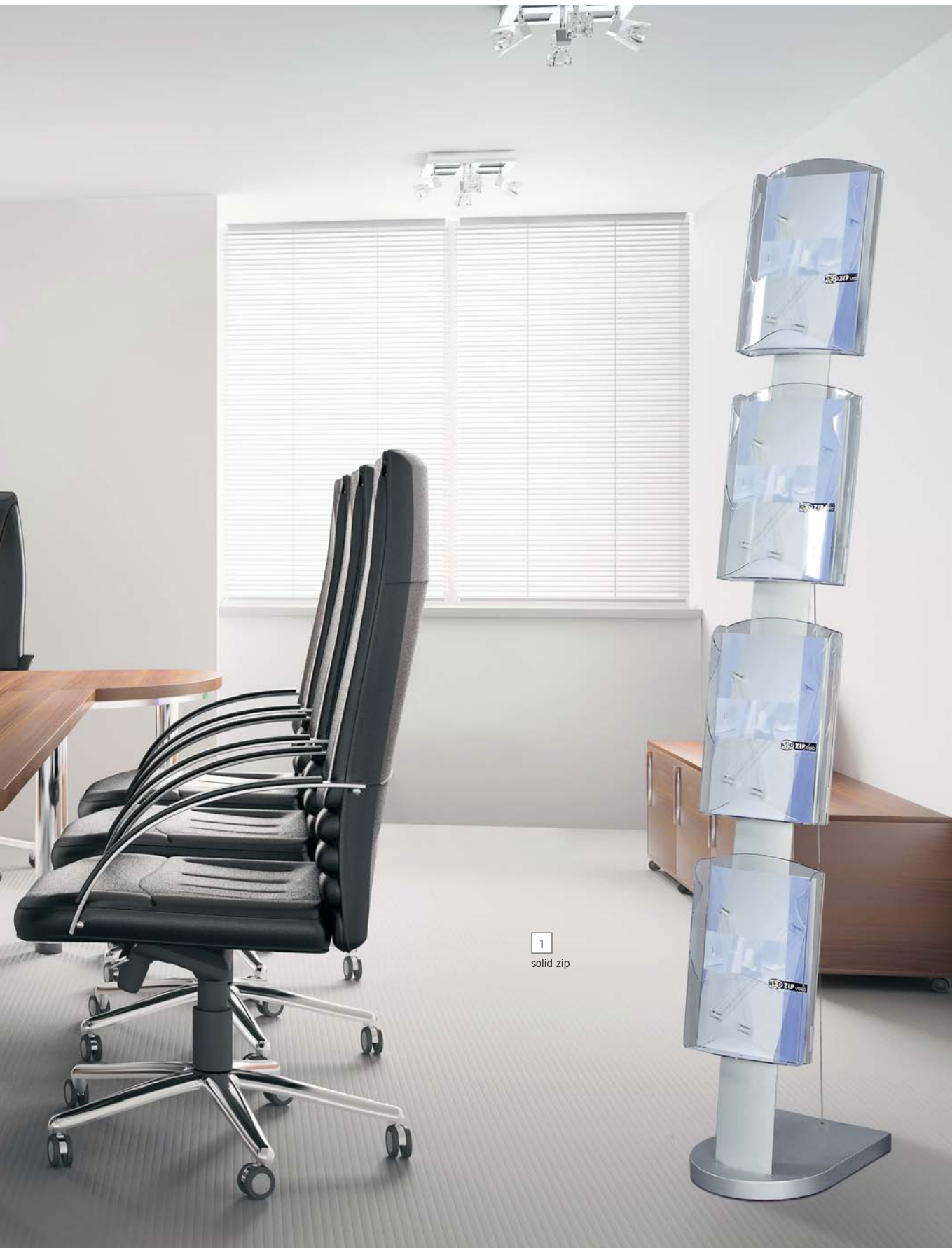
1 solid zip