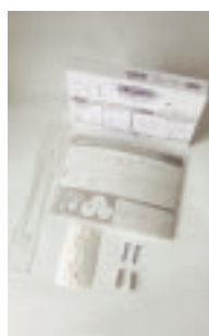
Art.-Nr. PQA5 17,60 Euro Transparentes Polycarbonat, Format A5, inkl. Stütze und Montagezubehör Gewicht: 0,3 kg