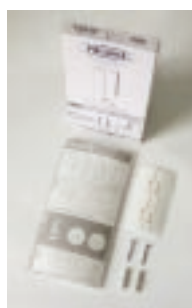
Art.-Nr. PQA6L 14,90 Euro Transparentes Polycarbonat, Format A6 large (210x105mm), inkl. Montagezubehör Gewicht: 0,3 kg