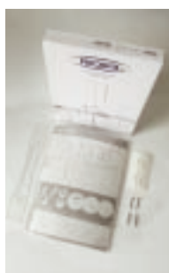
Art.-Nr. PQA4 19,80 Euro Transparentes Polycarbonat, Format A4, inkl. Stütze und Montagezubehör Gewicht: 0,5 kg