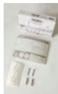
Art.-Nr. PQA6 12,00 Euro Transparentes Polycarbonat, Format A6, inkl. Montagezubehör Gewicht: 0,2 kg