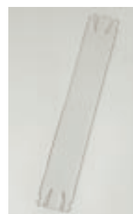
Art.-Nr. PQSA6PL 2,96 Euro Stütze in PETG für Format A6 und A6L Gewicht: 0,1 kg